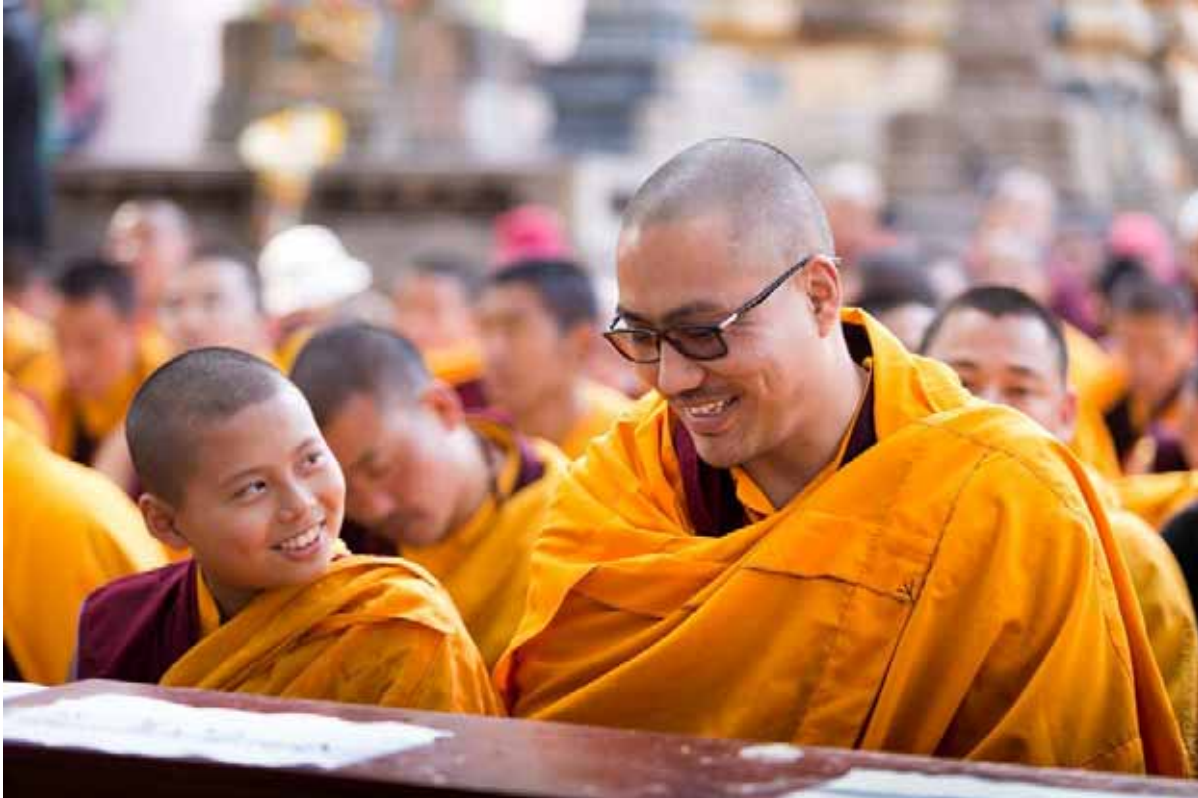
Un jeune maître Sakyapa, admirant le stoupa

Chez certains d'entre eux, la valeur n'attend pas le nombre des années !