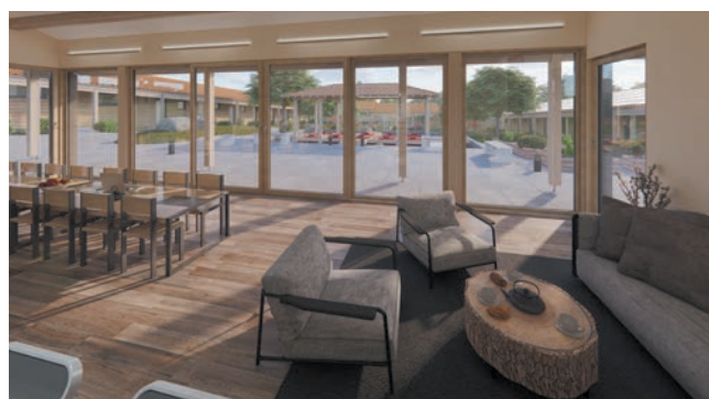
Vue depuis la salle commune

La mise en œuvre au quotidien : en se dédiant à l'activité du centre – rendant ainsi le Dharma accessible au plus grand nombre –, ce qui permet d'éprouver sa compréhension de l'étude et de la pratique méditative.